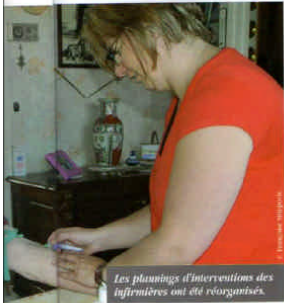
Les plannings d'interventions des infirmières ont été réorganisés.