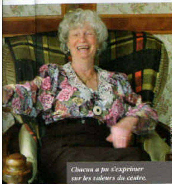
Chacun a pu s'exprimer sur les valeurs du centre.