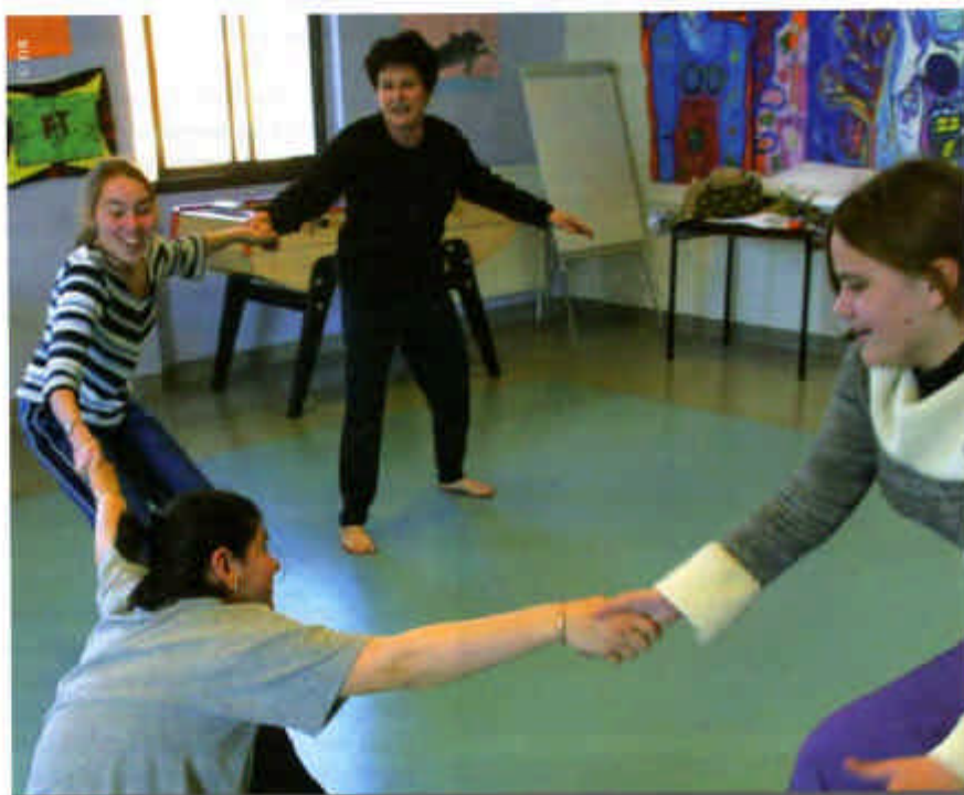
Plutôt que de consommer des médicaments, mettre son corps en mouvement... Un atelier santé ville à Benoit Frachon.

Exercice coordonné, tiers payant, prévention : le centre de santé Benoit Frachon, à Pierre Bénite, revendique une qualité de soin qui n'a rien à envier à la pratique libérale. Reportage.