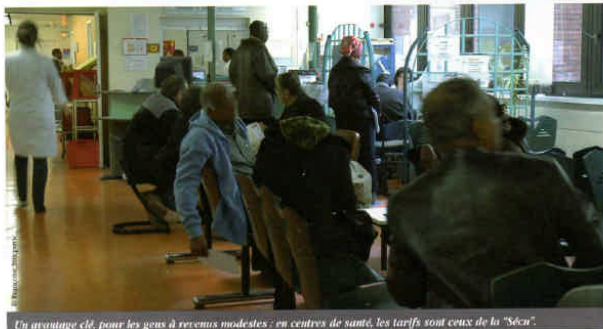
Un avantage clé, pour les gens à revenus modestes : en centres de santé, les tarifs sont ceux de la "Sécu".