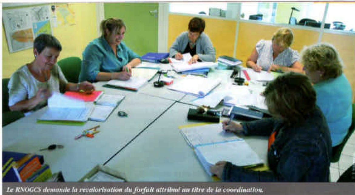
Le RNOGCS demande la revalorisation du forfait attribué au titre de la coordination.

les représentants des centres. Confronté à l'inertie de l'Assurance maladie au cours des négociations, contre laquelle il s'est maintes fois élevé - plusieurs propositions lui ont été remises, sans réponse aucune - le RNOGCS a pris acte fin 2008 de la volonté manifeste de la CNAMTS de ne pas s'engager dans un nouvel accord. Il a dès lors exigé de travailler non plus à un nouvel accord, ce qui manifestement était impossible, mais sous forme d'avenants à l'accord reconduit, avec en priorité :