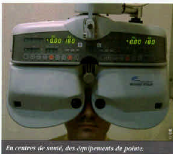
En centres de santé, des équipements de pointe.