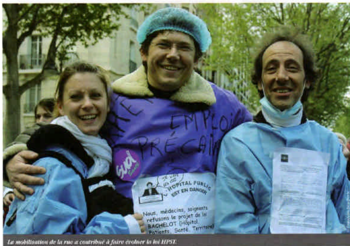
La mobilisation de la rue a contribué à faire évoluer la loi HPST.

La loi publiée, la balle sera dans le camp des centres : leurs représentants vont devoir se mobiliser pour tenter de peser sur les textes d'application; quant aux centres, leur tâche va être d'investir ce nouveau cadre d'exercice. ■